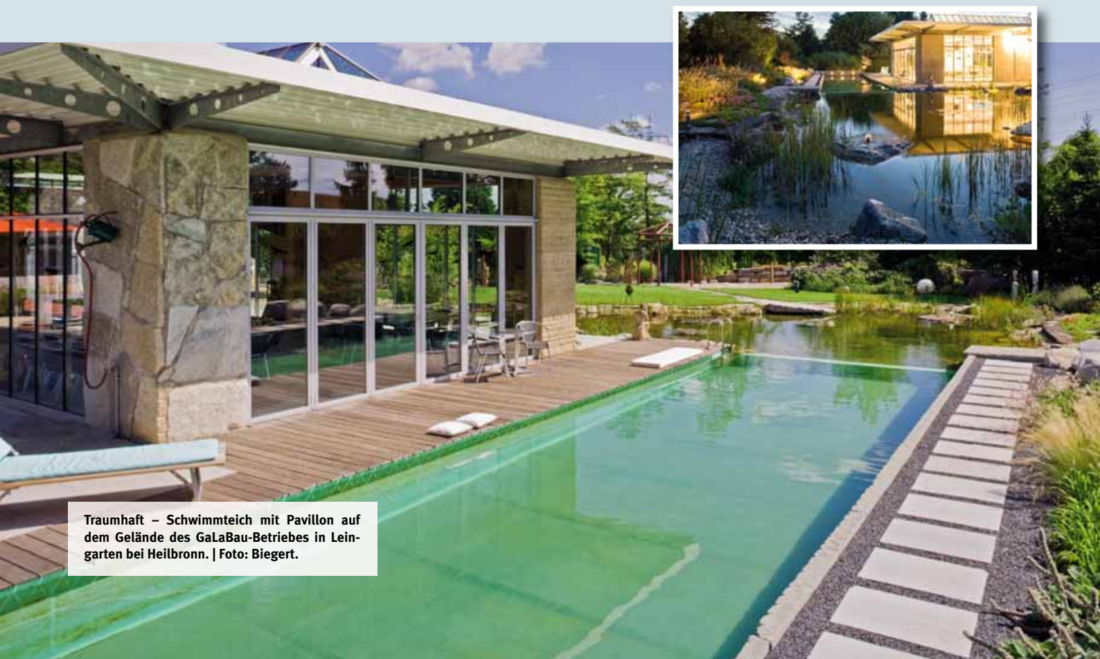
Traumhaft – Schwimmteich mit Pavillon auf dem Gelände des GaLaBau-Betriebes in Leingarten bei Heilbronn.