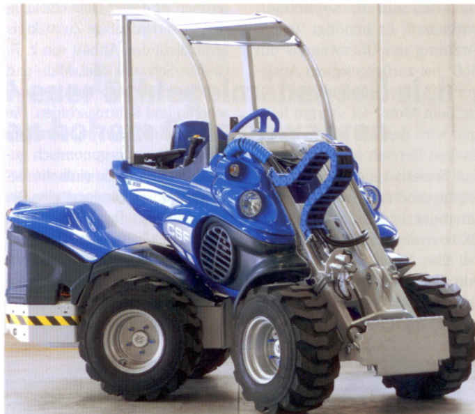
Der SL 835 aus der neuen Multifunktionsradlader-Serie bietet höhere Leistung, mehr Kraft, Stabilität sowie ein revolutionäres Design.

ersitz, Teleskophubarm, 11-Funktionen-Joystick, Hubarm-Schwimmstellung, Überroll Bügel mit Plexiglasdach und Diffe-